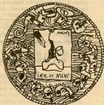
■ Pierre Alechinsky: Mitt i en värld som blivit yta.